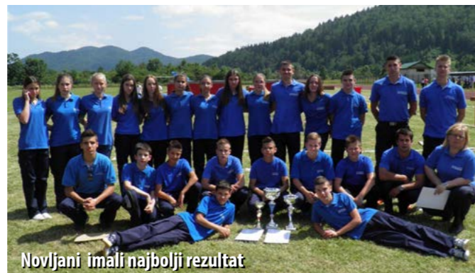
Novljani imali najbolji rezultat