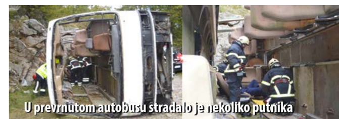
U prevrnutom autobusu stradalo je nekoliko putnika

Na drugoj radnoj točki simulirano je urušavanje industrijskoga objekta (tvornice za preradu mesa u kojoj se koristi amonijak). Potres je izazvao propuštanje amonijaka pa je, pored izvlačenja radnika, trebalo sanirati pukotinu na cjevovodu, oboriti oblak amonijaka, ugasiti požar spremnika i izmjeriti koncentraciju opasnih para u zraku. Istodobno, na tom je području došlo i do prevrtanja autobusa iz kojega je trebalo spasiti putnike i pružiti im hitnu medicinsku pomoć.