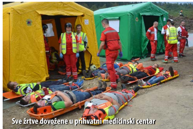
Sve žrtve dovožene u prihvatni medicinski centar

Tijekom dvodnevne priprema za završnu vježbu, sudionici kampa imali su vrlo opsežan teorijski i praktični program pa su tako obradili teme: tehnička oprema za rad na putničkom vagonu, energetska oprema, specijalna oprema na željezničkim nesrećama, taktika gašenja požara tehničkoga dijela putničkog vagona, siguran rad s polomljenim drvećem, sustavi podzemnih spremnika na benzinskim postajama, cestovni transport zapaljivih tekućina, urušavanje objekata kao posljedica potresa, funkcioniranje zdravstvene zaštite u ekstremnim uvjetima, potražni psi i pretraživanje ruševina, prometne nesreće većih razmjera kao posljedica potresa, spašavanje ljudi ispod poru-