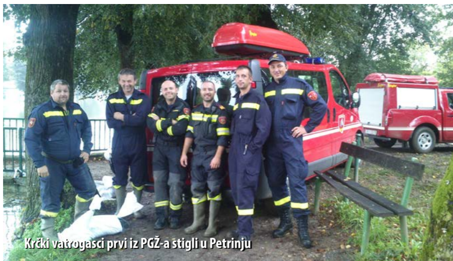
Krčki vatrogasci prvi iz PGŽ-a stigli u Petrinju