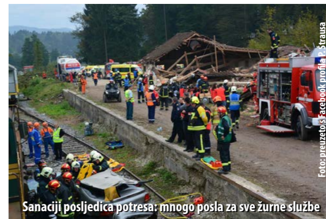
Sanaciji posljedica potresa: mnogo posla za sve žurne službe