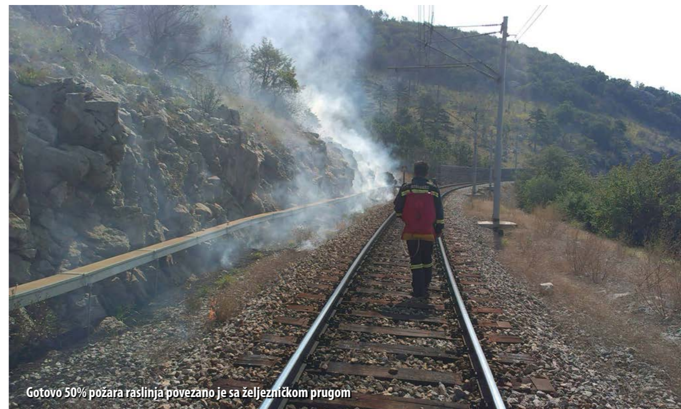
Gotovo 50% požara raslinja povezano je sa željezničkom prugom

Željeznička pruga Rijeka – Zagreb prelazi goranski planinski lanac. U samo 36 km spušta se s 830 mnm (ŽK Drivenik) na morsku razinu (ŽK Rijeka), što je prosječni nagib 23‰, a na nekim dionicama taj nagib prelazi čak i 28‰, zbog