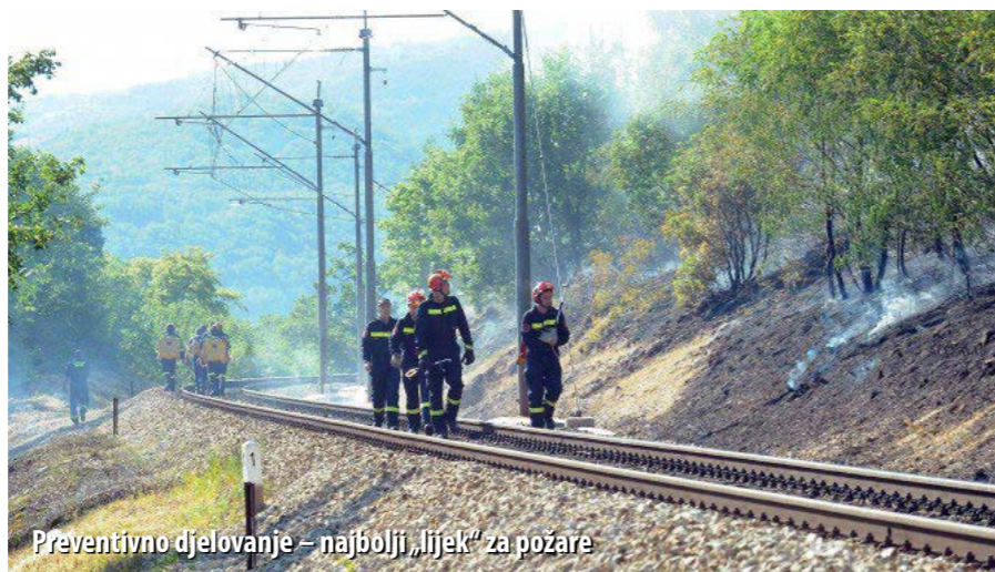
Preventivno djelovanje – najbolji „lijek“ za požare

dijelovi kočnica lete i po desetak metara. Posljednjih godina odustalo se od kemijskoga tretiranja pružnoga pojasa jer je tretiranje herbicidima nedozvoljeno u vodozaštitnim područjima. Netretiranje trave herbicidima ima za posljedicu njezin pojačan rast. Naime, iako se trava pokosi i spali, nakon kiše ona ponovo naraste, a u sušnome razdoblju se posuši i tako pretvori u zapaljivu tvar. Takvu situaciju imamo upravo ove godine kada unatoč dobrom čišćenju pružnoga pojasa, zbog česte izmjene vlažnih i sušnih razdoblja, stalno raste nova trava, kaže Mance te dodaje da se na pruzi Rijeka - Zagreb tretiranje pružnoga pojasa retardantima nikada nije provodilo, iako je bilo pokušaja.