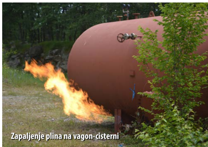
Zapaljenje plina na vagon-cisterni

Šapjane nisu slučajno izabrane za vježbu, s obzirom da upravo kroz Šapjane prolazi frekventna magistralna prometnica Rijeka-Trst, kao i željeznička pruga, a potencijalnu opasnost od požara na tom području mogu predstavljati i aktivnosti (šumski radovi) koje obavljaju Šumarija Opatija-Matulji i privatni vlasnici terena u okruženju. Uz to, u neposrednoj blizini nalaze se i dva granična prijelaza – Rupa i Pasjak.