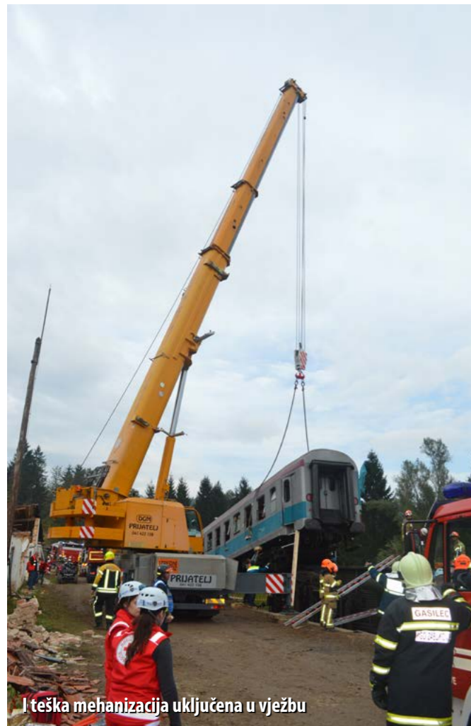
I teška mehanizacija uključena u vježbu