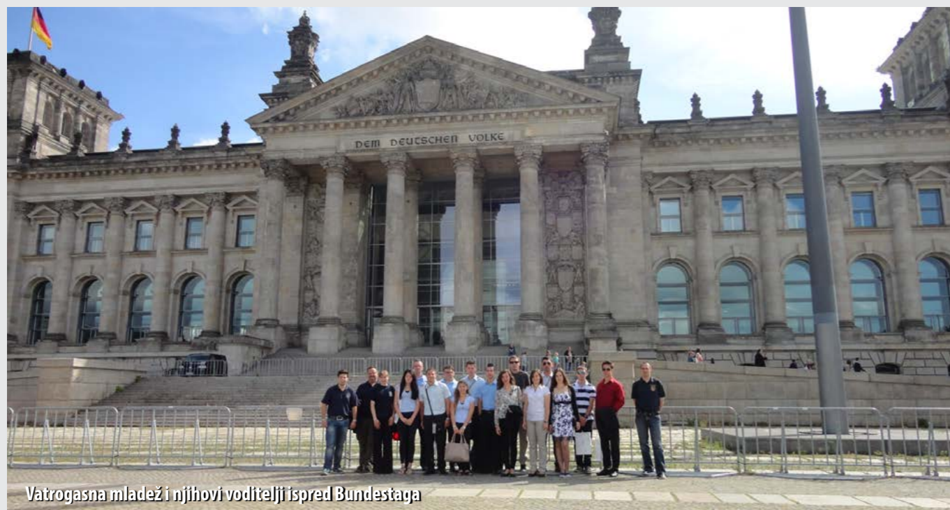
Vatrogasna mladež i njihovi voditelji ispred Bundestaga

Vatrogasna mladež Primorsko-goranske županije ovoga je ljeta boravila u Njemačkoj, u posjetu mladim kolegama iz okruga Fulda u Saveznoj Državi Hessen. Nastavak je to suradnje započete 2011. godine, kada je vatrogasna mladež iz Fulde boravila u Fažani, u kampu vatrogasne mladeži Hrvatske vatrogasne zajednice. Nakon tog susreta, svake godine organi-