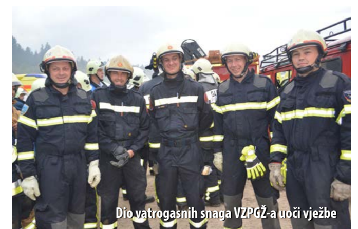
Dio vatrogasnih snaga VZPGŽ-a uoči vježbe