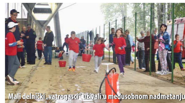
Mali delnički „vatrogasci“ uživali u međusobnom nadmetanju

U konkurenciji osam muških „B“ ekipa iz redova dobrovoljnih vatrogasaca najbolji je bio domaćin – DVD Delnice, kojem je pripao i prijelazni monitor kao najuspješnijoj ekipi memorijala. Drugo mjesto osvojila je ekipa PGD-a Šalka Vas, a treće DVD Skrad. Iako je DVD Ravna Gora bio posljednji, i njega treba spomenuti i to zbog srčanosti njegovih natjecatelja koju su s ukupnom starošću od 508 godina bili uvjerljivo najstarija ekipa na memorijalu.