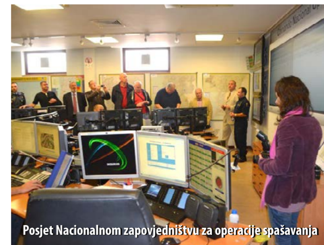
Posjet Nacionalnom zapovjedništvu za operacije spašavanja

Domaćini Nacionalnoga zapovjedništva za operacije spašavanja u Lisabonu predstavili su svoj sustav koordinacije i upravljanja vatrogasnim snagama, kao i ostalim sudionicima zaštite