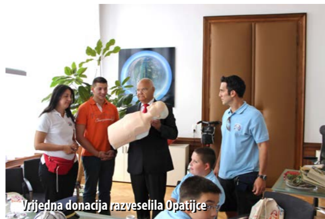
Vrijedna donacija razveselila Opatijce

Moramo napomenuti da smo jako ponosni na našu djecu, naše mlade vatrogasce, koji su u svakom trenutku izvanredno pred-