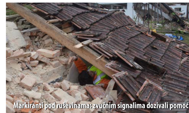
Markiranti pod ruševinama: zvučnim signalima dozivali pomoć