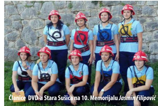
Članice DVD-a Stara Sušica na 10. Memorijalu Jasmin Filipović

Otkako je početkom 2013. godine izabrano novo vodstvo, DVD Stara Sušica aktivno se uključio u sva vatrogasna natjecanja. Prošle godine inicirano je formiranje muške A ekipe te je u 2013. godini DVD Stara Sušica djelovao s dvije ekipe, muškom A i B ekipom. Sredinom ove godine ponovno je okupljena ženska A ekipa, na veliko zadovoljstvo svih članova Društva pa danas DVD Stara Sušica na natjecanja odlazi s tri ekipe.