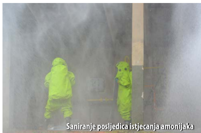
Saniranje posljedica istjecanja amonijaka