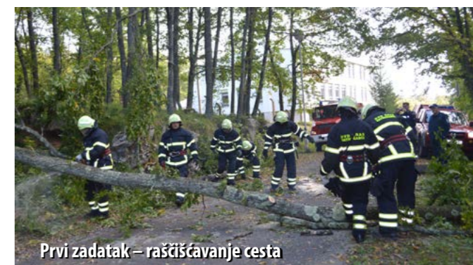
Prvi zadatak – raščišćavanje cesta