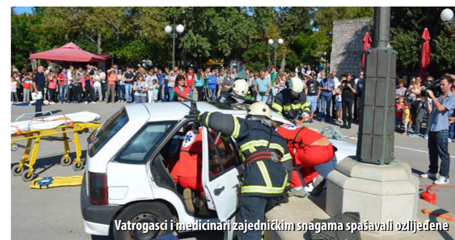
Vatrogasci i medicinari zajedničkim snagama spašavali ozlijeđene

Cilj vježbe bio je pokazati javnosti rad i suradnju žurnih službi, kao i uvježbanost krčkih vatrogasaca u rukovanju hidrauličkom i drugom opremom i tehnikom koja se koristi pri prometnim nesrećama za oslobađanje unesrećenih osoba iz automobila.