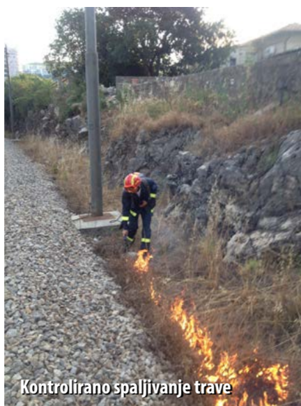
Kontrolirano spaljivanje trave

Kako bi smanjili broj požara uz prugu, 80-ih godina prošloga stoljeća vatrogasci su u suradnji sa željezničarima pokrenuli intenzivne radove na uklanjanju raslinja te redovita godišnja kemijska tretiranja trave herbicidima u pružnom pojasu, a vatrogasci su dodatno provodili i kontrolirano spaljivanje, čime se stvarala tampon zona od oko osam metara od osi kolosijeka. Takve su mjere učinkovite i pridonose smanjenju broja požara. - Postoje lokacije gdje je to teško provesti, a to se prvenstveno odnosi na naseljena područja i provalije gdje su te zone preuske, s obzirom na činjenicu da užareni