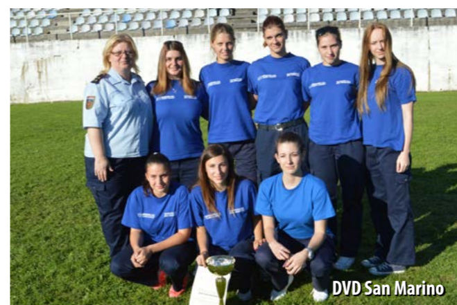
DVD San Marino