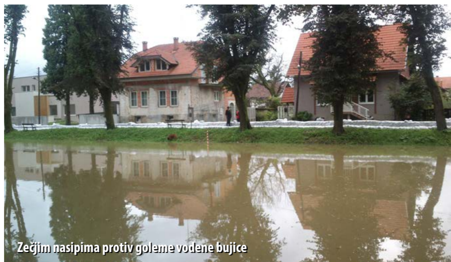
Zečjim nasipima protiv goleme vodene bujice