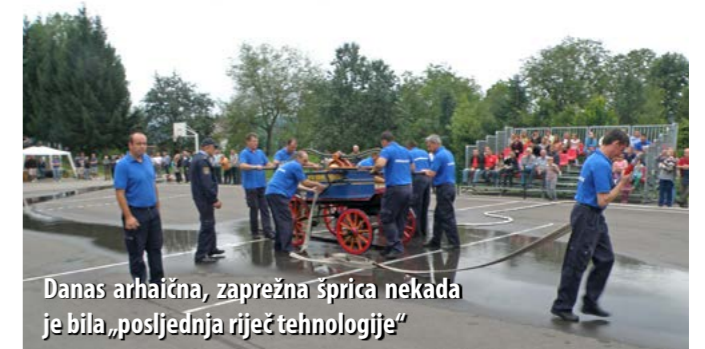
Danas arhaična, zaprežna šprica nekada je bila „posljednja riječ tehnologije“

Atraktivno natjecanje podsjetilo je na stara vremena, kada su za gašenje požara korištene vatrogasne crpke na zaprežnim kolima koje su nekada, prije 100 i više godina, vukli konji ili volovi, a znalo se dogoditi da kola vuku i sami vatrogasci. Umjesto gašenja požara, natjecateljske su ekipe morale mlazom vode srušiti plastične boce, napuniti posudu s vodom kroz uzak otvor, potom je trebalo mlazom vode tjerati loptu od dna do vrha vatrogasnih ljestava, a četvrti se zadatak odnosio na rušenje mete (limenki piva), postavljenih na različitim visinama.