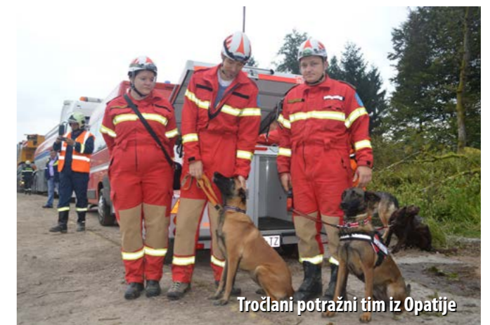
Tročlani potražni tim iz Opatije

Naposljedku spomenimo i jednu zanimljivost: tijekom vježbe došlo je i do stvarnog ozljeđivanja jednoga vodiča spasilačkih pasa koji je nespretno pao i slomio ruku, a prvi su mu u po-