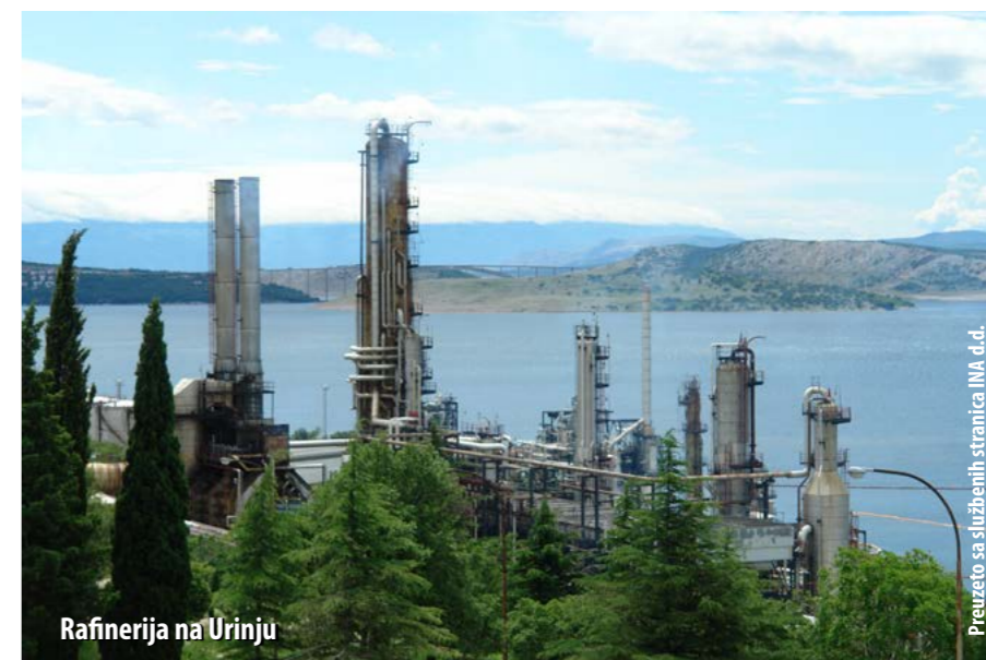
Rafinerija na Urinju

Uzrok požara koji je 17. kolovoza izbio u rafineriji na Urinju je tehnički kvar. Požar je prouzročio tek neznatno onečišćenje tla oko sustava zahvaćenog vatrom, a dva su vatrogasca lakše ozlijeđena. Šteta je procijenjena na oko 750 tisuća kuna. Proizvodnja u tom dijelu rafinerije privremeno je bila prekinuta.