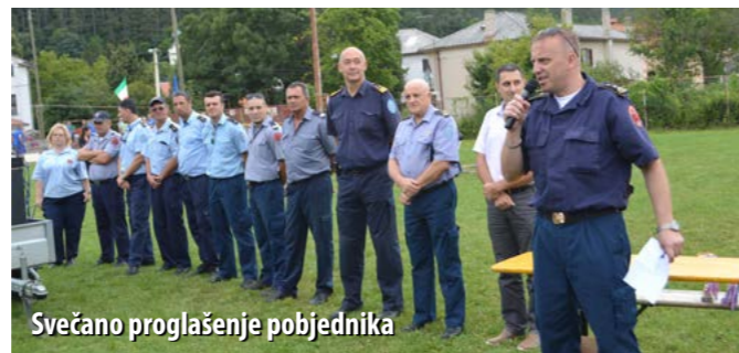
Svečano proglašenje pobjednika

U kategoriji „mladež M“, od ukupno šest ekipa, prvo mjesto zauzela je ekipa DVD-a San Marino-Novi Vinodolski, drugi je bio DVD Sušak, a treći DVD Lokve.