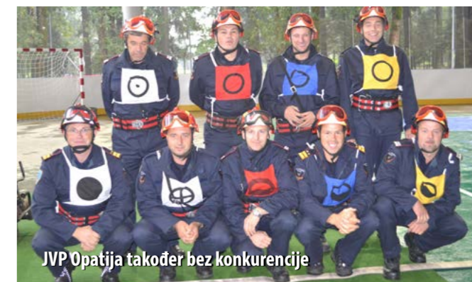
JVP Opatija također bez konkurencije