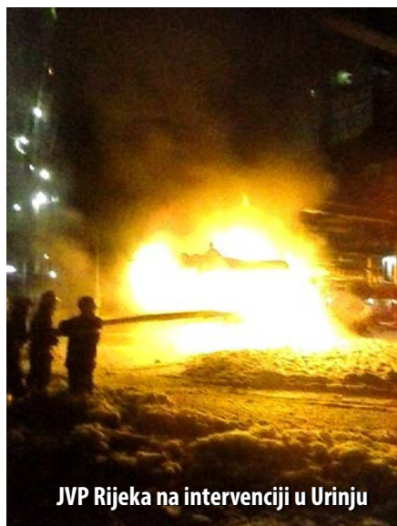
JVP Rijeka na intervenciji u Urinju

U 22:46 h IPVJ RNR zatražio je pomoć vatrogasnih postrojbi JVP-a Grada Rijeke. Na intervenciju su upućena tri vatrogasna vozila. Na putu do Urinja, vođitelja smjene, Željka Ornika, VOC je obavijestio da su pripadnici IPVJ RNR započeli s gašenjem požara, ali da ga ne uspijevaju staviti pod kontrolu. Po dolasku na mjesto intervencije, u dogovoru sa zapovjednikom intervencijske ekipe IPVJ RNR, JVP-a Grada Rijeke uključio se u intervenciju postavljanjem dva mlaza teške pjene i to jedan "C" i jedan "B" mlaz s jugozapadne strane postrojenja. Naknadno je u svrhu hlađenja plašta kolone postavljen prijenosni monitor s istočne strane postrojenja. Budući da požar nije stavljen pod kontrolu, u 23:31 h zatraženo je pojačanje pa su u Urinj upućena još dva vozila riječkoga JVP-a, a istodobno je mobilizirana cjelokupna 3. smjena, da bi se osiguralo normalno funkcioniranje postrojbe koja je popunjena u 00:19 h.