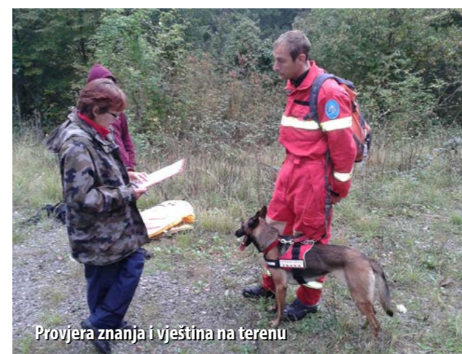
Provjera znanja i vještina na terenu

Sredinom rujna Povjerenstvo za potražne pse HVZ-a provelo je licenciranje vatrogasnih timova za spašavanje iz ruševina i traženje nestalih u prirodi. Licenciranje, koje se provodilo na području Primorsko-goranske županije, pristupilo je petero vatrogasaca sa svojim psima, a zadovoljilo ih je troje.