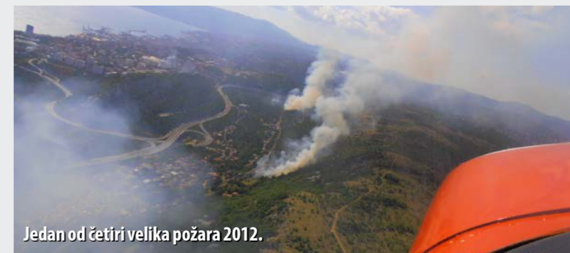
Jedan od četiri velika požara 2012.

Najgora u posljednjih dvadesetak godina bila je 2012. godina kada su uz prugu nastala četiri velika požara za čije je gašenje svaki put bilo angažirano po stotinjak vatrogasaca i zračne snage. Željeznički promet bio je u prekidi. U požarima je izgorjelo oko 100 ha borove i hrastove šume, niskoga raslinja i pašnjaka, a bila su ugrožena čak i naselja u Sušačkoj Dragi te Industrijska zona Kukuljanovo. Također je u prekidi bila opskrba električnom energijom. Prilikom gašenja, dvojica vatrogasaca lakše su ozlijeđena, a pored materijalnih šteta i velikih troškova intervencija, nastale su i znatne gospodarske štete.