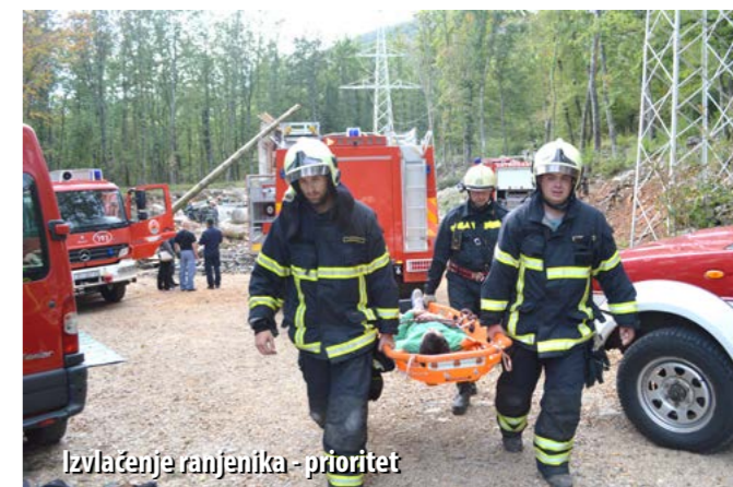
Izvlačenje ranjenika - prioritet

Potres kao jedna od najozbiljnijih ugroza koje prijete Primorsko-goranskoj županiji (tj. posljedice koje bi on mogao prouzročiti), bio je glavna tema velike združene godišnje vježbe koja je početkom listopada održana u vatrogasnome obučnom centru u Šapjanama. U vježbi su bile uključene sve snage sustava zaštite i spašavanja: Vatrogasna zajednica PGŽ-a, Područni ured za zaštitu i spašavanje, Zavod za hitnu medicinu, Hrvatska gorska služba spašavanja, Crveni križ, Zavod za javno zdravstvo PGŽ-a, Hrvatska udruga potražnih pasa i Policijska uprava Rijeka. Potporu navedenim službama dali su i pripadnici liburnijskih DVD-ova, uključujući i vatrogasnu mladež, koji su se tijekom vježbe pojavili u ulozi stradalih osoba (markiranata).