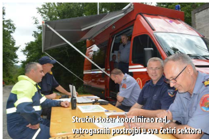
Stručni stožer koordinirao rad vatrogasnih postrojbi u sva četiri sektora

U gašenju požara sudjelovalo je ukupno 88 vatrogasaca s 24 vozila, točnije vatrogasne postrojbe DVD-ova Kras-Šapjane, Škalnice, Klana, Opatija, Lovran, Sisol i Učka, JVP-i Opatija i Rijeka te postrojbe Gasilske zveze Ilirske Bistrice (PGD-ovi Podgrad, Jelšane, Ilirska Bistrica, Podgora, Knežak, Vrbovo i Koritnice).