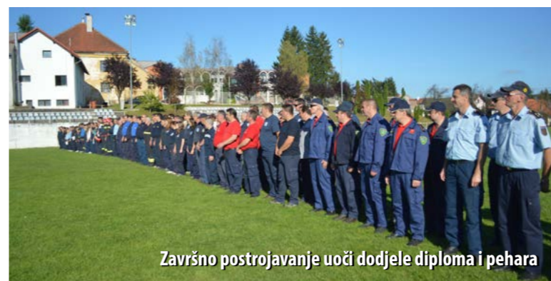
Završno postrojavanje uoči dodjele diploma i pehara