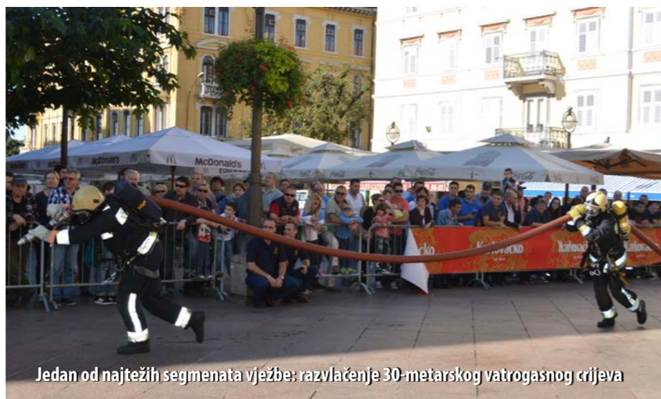
Jedan od najtežih segmenata vježbe: razvlačenje 30-metarskog vatrogasnog crijeva

Potkraj rujna u Rijeci je održan tradicionalni, 7. po redu memorijal Riječke vatre, natjecanje u vrlo zahtjevnoj disciplini Fire Combat, pokrenuto u čast Ede Surine i ostalih riječkih vatrogasaca, poginulih na intervencijama prilikom spašavanja ljudi i imovine.