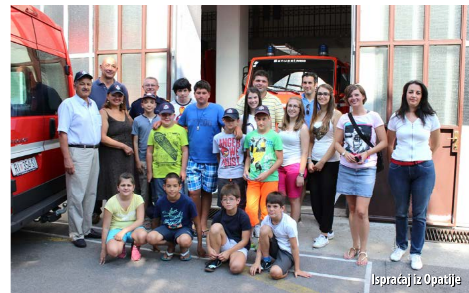
Ispraćaj iz Opatije

Također smo obišli gradsku Vodospremu, vidjeli smo odakle tako dolazi voda za više od 2,5 milijuna stanovnika Beča. Posjetili smo Hundertwasserhaus, gradski atletski stadion, kao i Donauturm Wien, bečki toranj visok 252 m. Potom smo se zabavljali u parku Prater, družili se s vatrogascima ronionicima u postaji Leopoldstadt, plovili Dunavom u vatrogasnom gliseru. Obišli smo i središnju vatrogasnu postaju Am Hof te vatrogasni muzej koji se nalazi u sklopu nje. Otišli smo i na jedan od najvećih bazena u Beču, prošetalim središtem grada, kušali bečke