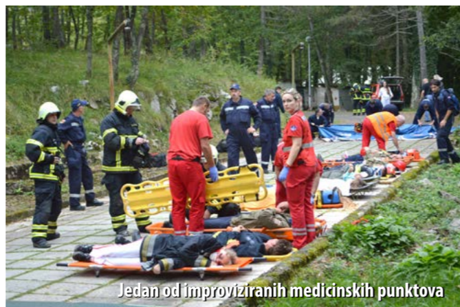
Jedan od improviziranih medicinskih punktova

Na trećem poligonu simulirano je urušavanje zgrade dječjega vrtića u kojemu se u trenutku potresa nalazilo 10-ak djece i dvije odgajateljice. Uz pomoć potražnih pasa trebalo ih je što prije spasiti, a spasiteljima su posao otežavali i uzrujani roditelji koji su nasilno htjeli ući u zgradu i sami sudjelovati u pronalasku i izvlačenju svoje djece.