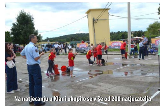
Na natjecanju u Klani okupilo se više od 200 natjecatelja