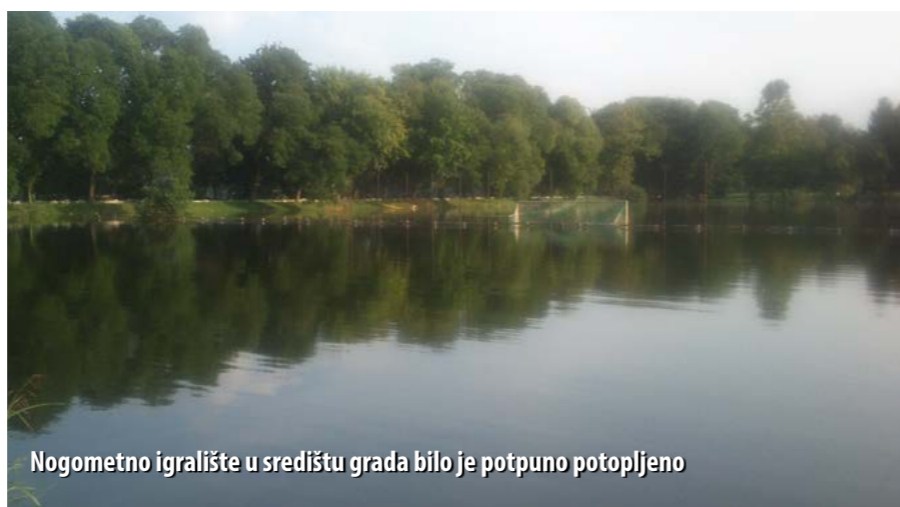
Nogometno igralište u središtu grada bilo je potpuno potopljeno