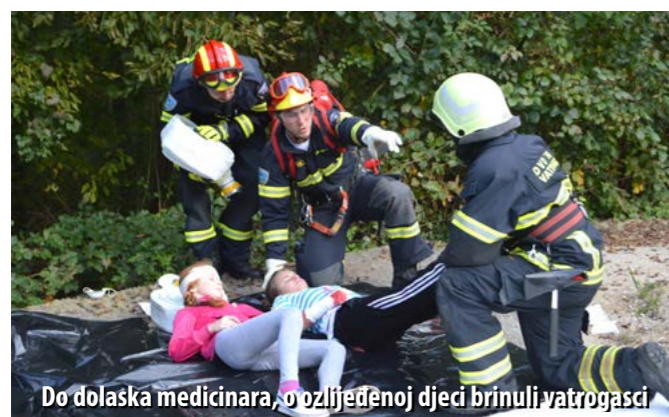
Do dolaska medicinara, o ozlijeđenoj djeci brinuli vatrogasci

Potražni psi korišteni su i kao ispomoć Gorskoj službi spašavanja čiji su pripadnici na četvrtoj radnoj točki, u šumi, tražili osobe koje su u panici pobjegle u šumu i izgubile se.