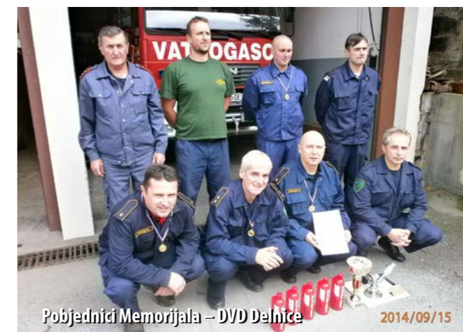
Pobjednici Memorijala – DVD Delnice 2014/09/15

U povodu blagdana sv. Roka, Dana Općine Klana, u Klani je 16. kolovoza održano 12. rokovsko natjecanje vatrogasne djece i mladeži u organizaciji DVD-a Klana. Na natjecanju su nastupile 23 ekipe iz 14 DVD-ova: Zlobin, Plešće, San Marino-Novi Vinodolski, Škrležvo, Kras-Šapjane, Lokve, Vrbovsko, Delnice, Halubjan, Njivice, Sušak, Donja Dubrava (Međimurska županija), Zabok (Krapinsko-zagorska županij) i