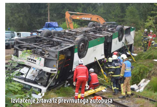
Izvlačenje žrtava iz prevrnutoga autobusa