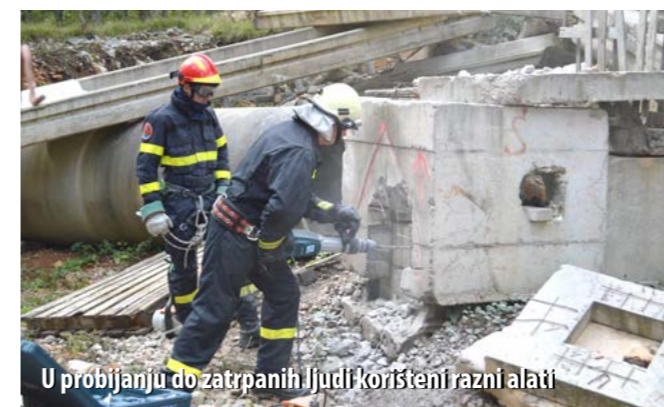
U probijanju do zatrpanih ljudi korišteni razni alati