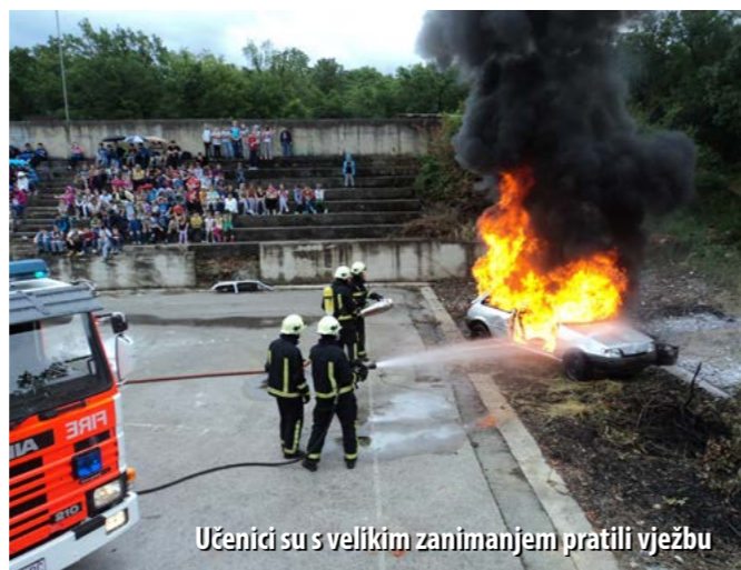
Učenici su s velikim zanimanjem pratili vježbu

Spomenuta vježba, uz ostale aktivnosti, dio je nastojanja kraljevičkih vatrogasaca da i najmlađe sugrađane upoznaju sa