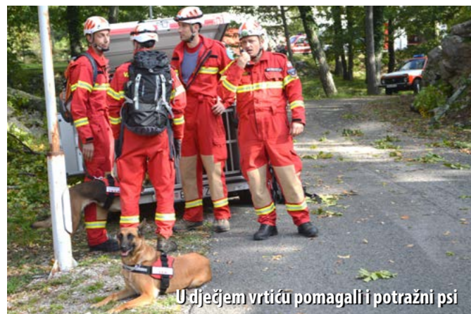
U dječjem vrtiću pomagali i potražni psi