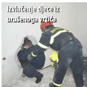
Izvlačenje djece iz urušenoga vrtića

Potražni psi korišteni su i kao ispomoć Gorskoj službi spašavanja čiji su pripadnici na četvrtoj radnoj točki, u šumi, tražili osobe koje su u panici pobjegle u šumu i izgubile se.