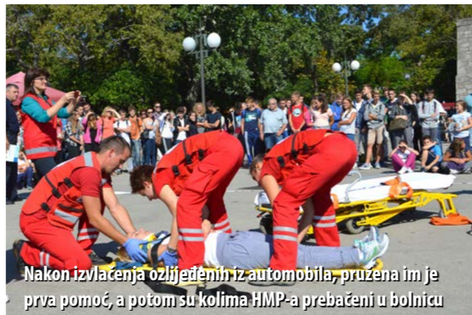
Nakon izvlačenja ozlijeđenih iz automobila, pružena im je prva pomoć, a potom su kolima HMP-a prebačeni u bolnicu

Na krčkoj rivi tako su vatrogasci iz automobila izvlačili tri ozlijeđene osobe koje su potom preuzeli djelatnici HMP-a, dok je policija osiguravala mjesto nesreće. Istodobno, volonteri CK-a građanima su besplatno mjerili tlak i šećer u krvi.