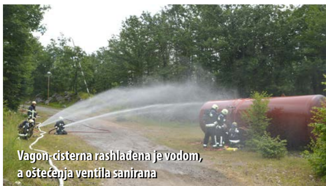
Vagon-cisterna rashlađena je vodom, a oštećenja ventila sanirana