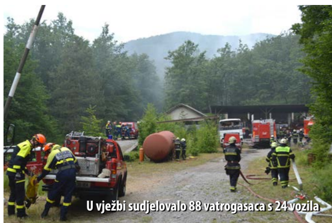
U vježbi sudjelovalo 88 vatrogasaca s 24 vozila

Vatrogasna zajednica PGŽ-a, Područna vatrogasna zajednica Liburnije i Gasilska zveza Ilirske Bistrice organizirali su potkraj lipnja zajedničku vatrogasnu vježbu na vatrogasnome vježbalištu u Šapjanama. Organiziranje zajedničke vježbe pograničnih vatrogasnih postrojbi Hrvatske i Slovenije inicirao je DVD Kras-Šapjane, a svrha je vježbe, među ostalim, bila problematika povezana s prijelazom državne granice u slučajevima pograničnih požara otvorenoga prostora, što se u posljednjih nekoliko godina u praksi i potvrdilo jer se znalo događati da interventne ekipe moraju čekati i više od pola sata da bi prešle granicu.