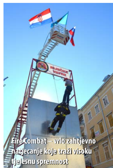
Fire Combat – vrlo zahtjevno natjecanje koje traži visoku tjelesnu spremnost