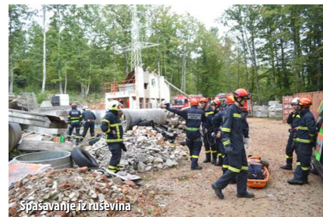
Spasavanje iz ruševina