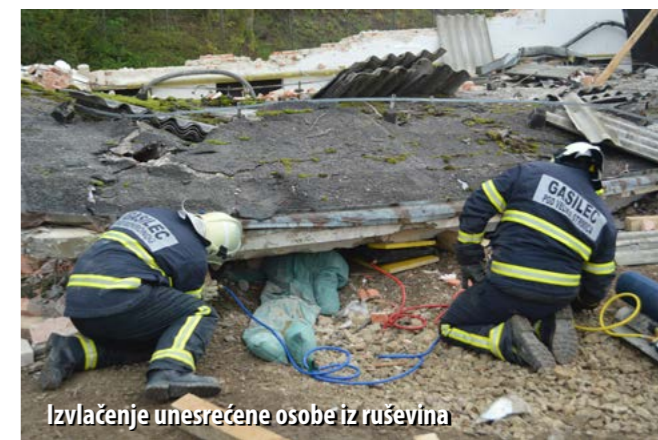
Izvlačenje unesrećene osobe iz ruševina

U organizaciji slovenskoga Zavoda Vizija Varnosti i Slovenskih željeznica, od 18. do 20. rujna u mjestu Puščava (općina Šentrupert) održana je dosad najveća pokazna vježba u Sloveniji na kojoj je 600-ak sudionika, pripadnika svih žurnih službi, „rješavalo“ posljedice simuliranoga velikog potresa.