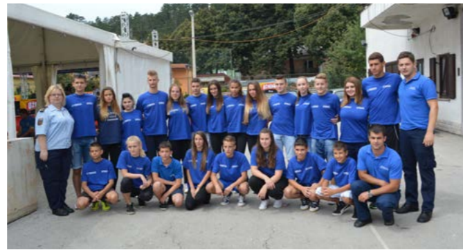
Novljanska ekipa „mladež M“ s vremenom 46,6 sekundi imala je najbolji rezultat dosad postignut na nekom službenom županijskom natjecanju u toj kategoriji

U kategoriji „djeca Ž“ nastupile su tri ekipe. Prvo mjesto pripalo je DVD-u Škrlevo, drugo mjesto zauzela je ekipa DVD-a Klana, a treće DVD Njivice. Ekipa DVD-a Sušak 1 zauzela je prvo mjesto u kategoriji „djeca M“. Drugo mjesto pripalo je DVD-u Zlobin, a treće mjesto ekipi Delnice 1. Ukupno je u ovoj kategoriji nastupilo deset ekipa.