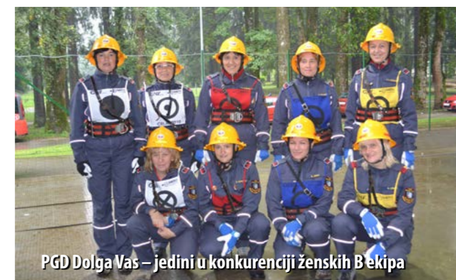
PGD Dolga Vas – jedini u konkurenciji ženskih B ekipa