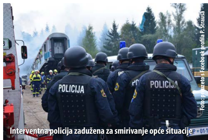
Interventna policija zadužena za smirivanje opće situacije