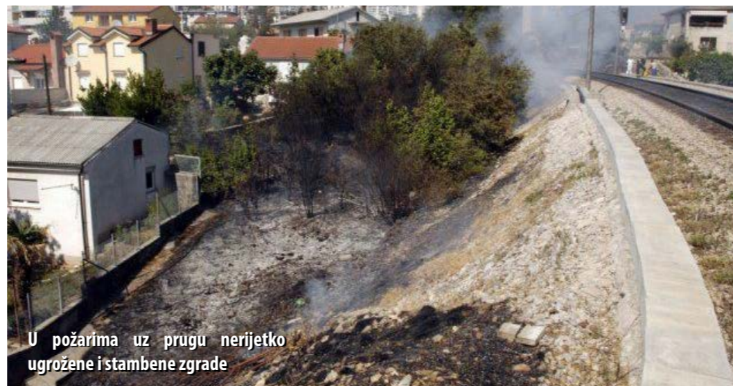
U požarima uz prugu nerijetko ugrožene i stambene zgrade