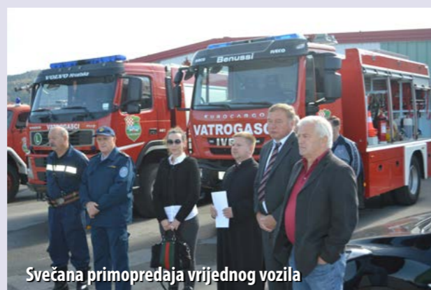
Svečana primopredaja vrijednog vozila

vatrogascima sve veći izazovi te da je ulaganje u vatrogasni ustroj preduvjet razvoja i kvalitete.