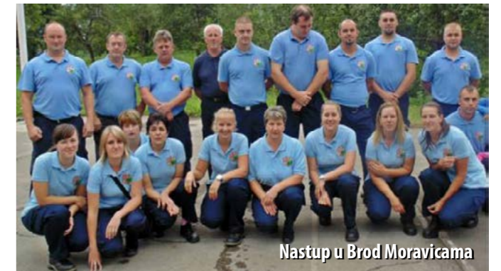
Nastup u Brod Moravicama

Debi ženske ekipe bio je u kolovozu u Novom Vinodolskom, na 10. Memorijalu Jasmin Filipović na kojem su cure osvojile 8. mjesto. Muška ekipa osvojila je 24. mjesto što je najbolji rezultat muških ekipa iz Vatrogasne zajednice Općine Ravna Gora.